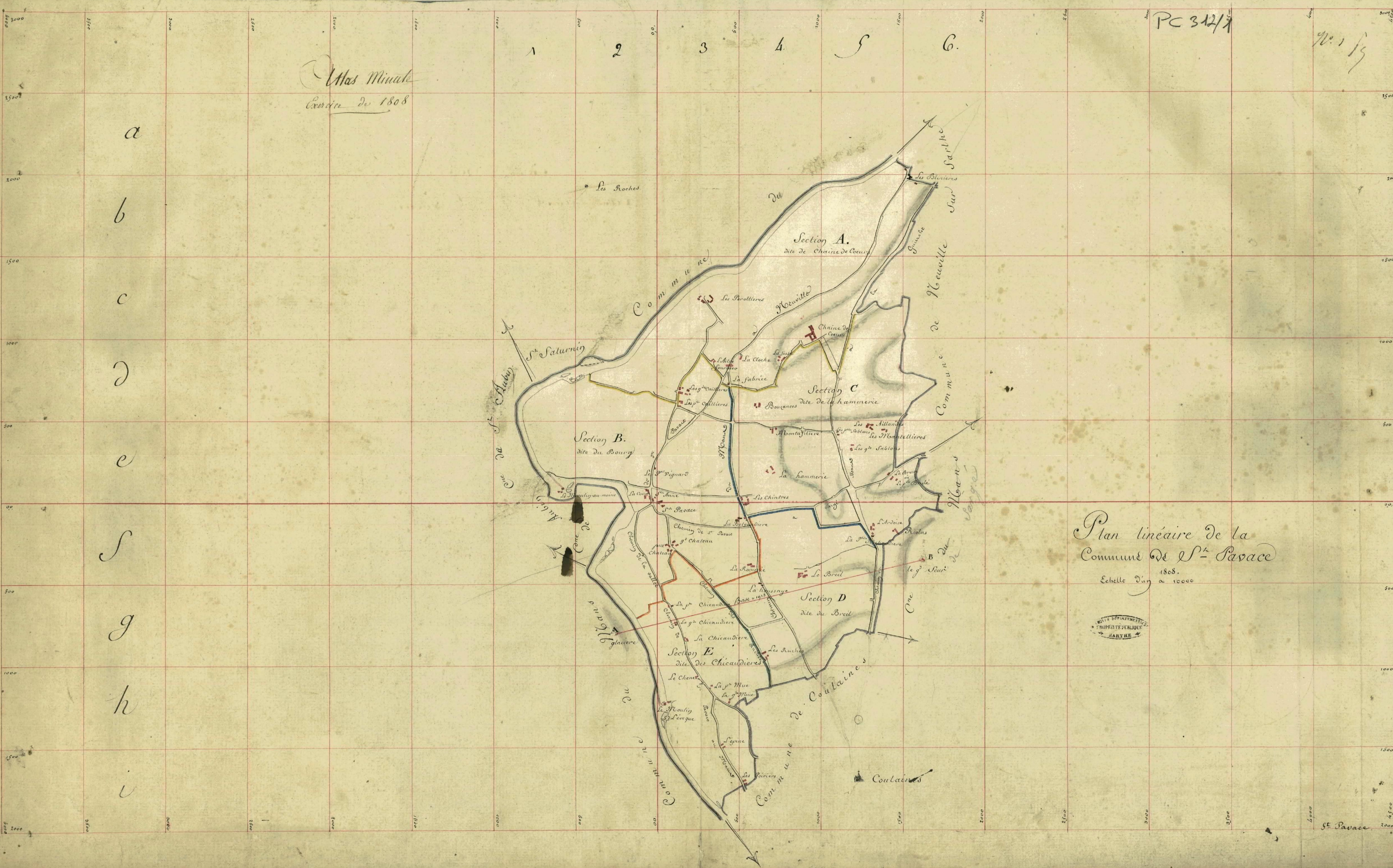
Plan linéaire de la Commune de St-Pavace 1808. Echelle d'un a 10000