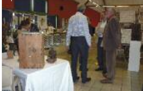
Exposition des Créateurs et Amis de l'Art

Toujours très appréciée par sa qualité, la 10 ème édition de l'exposition de peintures, sculptures, bijoux, ... présentée par une vingtaine d'artistes a attiré un nombreux public pendant le week-end du 16 au 17 avril.