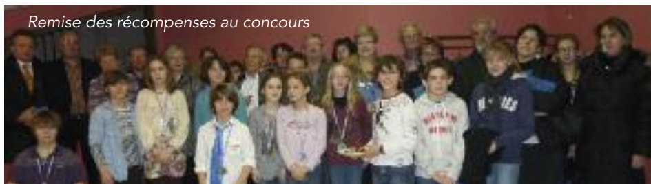
Remise des récompenses au concours

Samedi 23 juin : à 20h30 répétition publique de la chorale HARMONIA, devant la mairie, à l'occasion de la Fête de la Musique