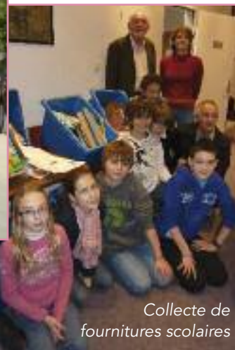
Collecte de fournitures scolaires