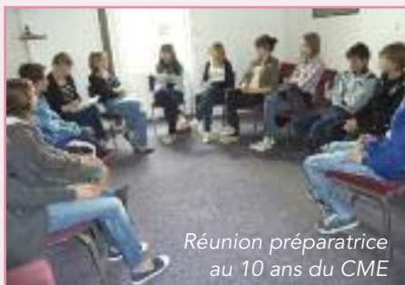
Réunion préparatrice au 10 ans du CME