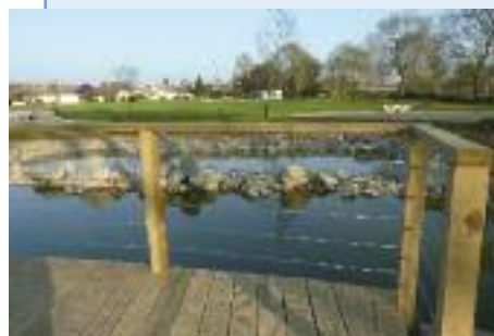
Réception de la mare découverte

Une signalétique sera conçue et installée sur le site. L'association Sarthe Educ Environnement préconise qu'il n'est pas nécessaire d'introduire des animaux dans la mare, car elle sera colonisée spontanément.