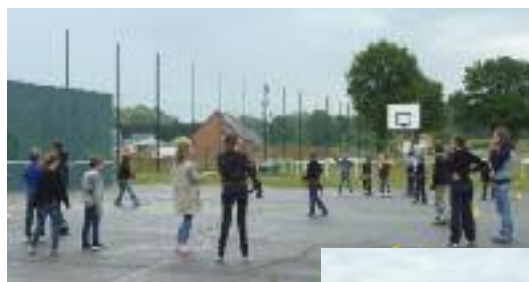
Grillage côté stade

Grillage le long des lotissements : CARRE VERT pour 31 618,05 € TTC